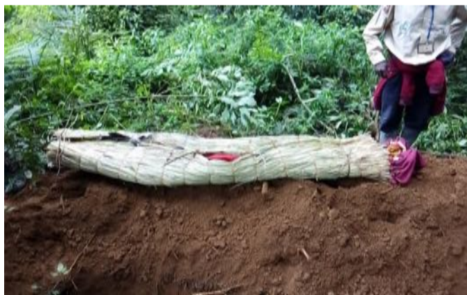
Inhumation des deux « réfugiés » rwandais tués au cours d'un affrontement armé qui avait opposé deux groupes armés Mai-Mai congolais à Muhuzi.

Entre 2016-2017, une opposition s'est manifesté au sein des FDLR/Foca et avait fragmenté ce groupe armé étrangers en deux factions : FDLR/Foca et le CNRD. La faction CNRD avait été sous-traité par les FARDC afin d'atteindre le leader tant recherché Sylvestre Mudacumura. C'est ainsi que les rapports, ayant été changé et que le Président Tshisekedi s'étant rapproché de Kigali, les opérations militaires conjointes FARDC, et forces spéciales Rwandaises finiraient par neutraliser Sylvestre Mudacumura. Concomitamment, les FARDC commenceront la traque contre les CNRD au point de les chasser de Masisi, Rutshuru vers le territoire de Kalehe (Sud-Kivu). En 2020, des opérations militaires les ont imposés et avaient permis de capturer certaines d'entre eux que la MONUSCO et les FARDC avaient rapatrié au Rwanda à partir de la frontière Ruzizi 1 er . Bien que ceux qui étaient dans les chefferies de Luhwindja, de Lwindi et dans le secteur d'Itombwe se soient éloignés vers le territoire de Fizi, ils se sont réorganisés malgré leurs disputes internes et d'autres seraient récemment revenus à Lwindi. S'étant